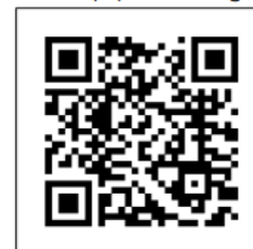
UCI Equipment Page

Thank you very much for your attention to these instructions. We would once again like to remind you that you should not hesitate to contact the Commissaires in the event of any problem or doubts regarding equipment.